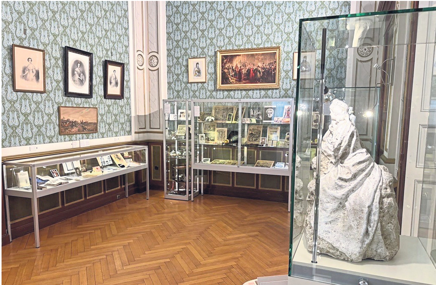
Das Kaiserin Elisabeth Museum hat die Renovierungen gut überstanden und kann bald wieder Besucher begrüßen.

Das aktive Team des Museums besteht aus insgesamt 23 Frauen und einem Mann, die die Führungen leiten. „Wir machen das alles ehrenamtlich“, sagt Mann-Stein. Das Geld, das dadurch eingenommen wird, nutzt das