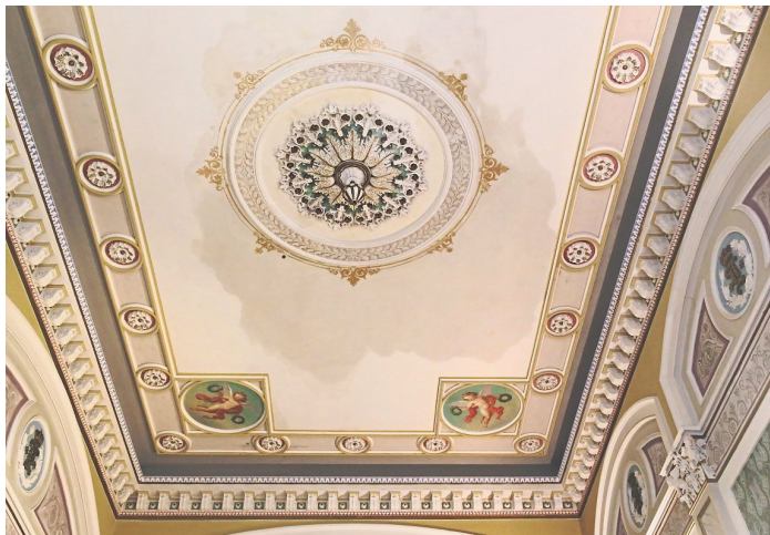
Die prunkvolle Decke mit dem 2024 entstandenen Wasserschaden. Inzwischen ist alles repariert.